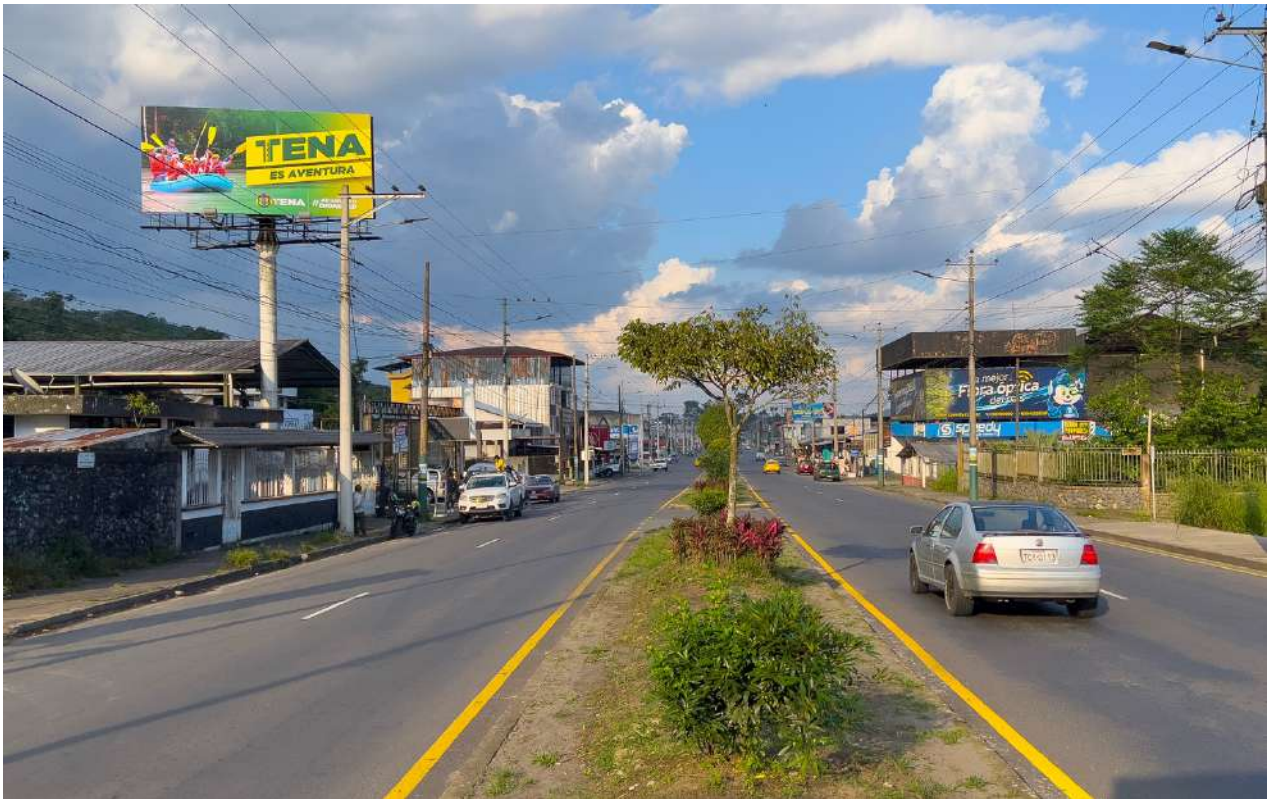
Loja – Entrada a la ciudad