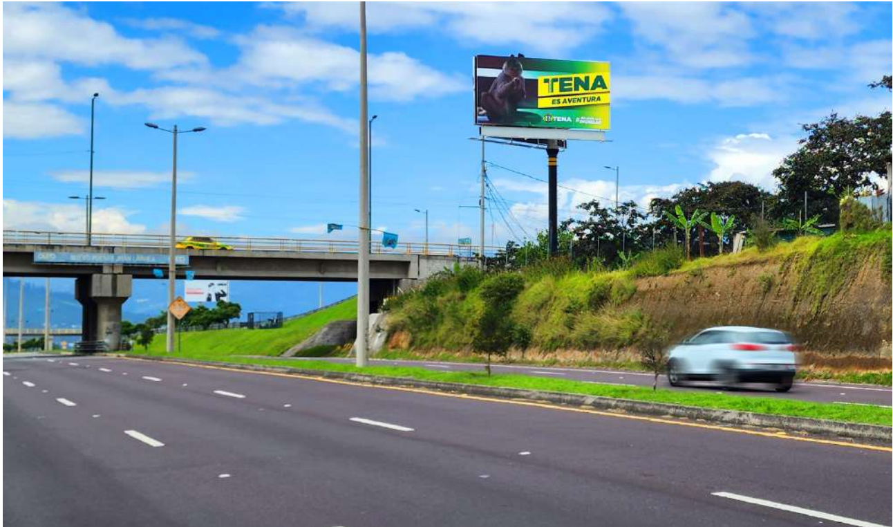
Alóag – Santo Domingo